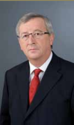
Le Premier ministre Jean-Claude Juncker