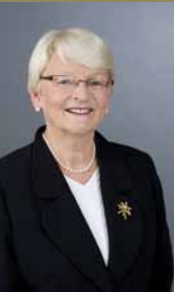
La Ministre de la Coopération et de l'Action humanitaire Marie-Josée Jacobs