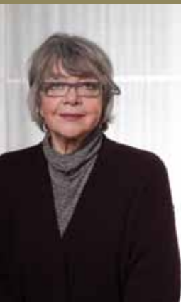
La Médiatrice Lydie Err

La cohérence des politiques doit également se poursuivre au niveau européen. L'engagement européen dans ce domaine est d'ailleurs explicitement prévu par les articles 208 à 210 du Traité de Lisbonne (ancien titre XX du traité de Maastricht). Depuis 2007, il existe au niveau de l'Union européenne un rapport très détaillé {SEC(2007)1202} qui analyse la cohérence des politiques de l'UE en matière de coopération au développement. En 2010, la Commission européenne a présenté le Programme de travail pour la Cohérence des Politiques