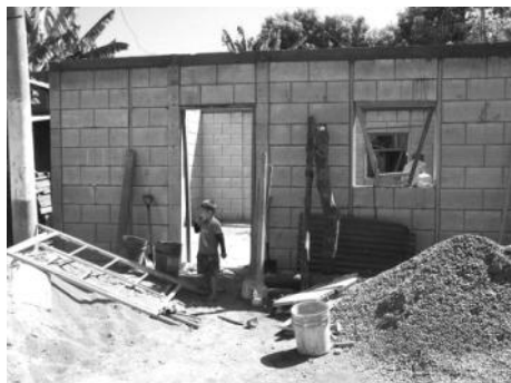
Am Duerf El Jobal op der Insel El Espíritu Santo si schon e puer Haisercher am Réibau fäerdeg.