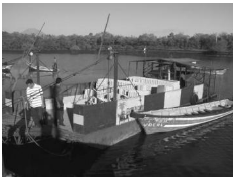
Den Transport vum Baumaterial vum Festland op d'Insel ass eng aussergewöhnlech Erausforderung, well d'Pont nëmme ka mat der Charge fuere wann d'Mier héich ass.

De 25. Februar war d'Generalversammlung vun der Fondatioun, wou mer e Réckbléck op 2009 an en Ausbléck op 2010 gehäit hunn. Aus de Rapporten vum leschte Joer gräifen ech e puer Fakten eraus: